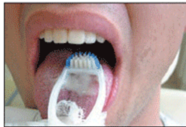
Figura 6 - Técnica de limpeza da língua - "removendo a saburra lingual".