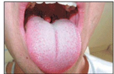
Figura 7 - Língua - aspecto inicial antes da limpeza.