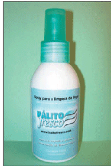
Figura 4 - Solução de limpeza da língua Hálito fresco® em "spray".

2) Fazer movimentos circulares ou de vai-e-vem com as cerdas (escova) do limpador de língua na parte posterior da língua para "soltar" a saburra lingual (Figura 5).