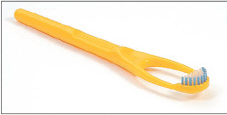
Figura 1 - Limpador de Língua Hálito fresco® - vista diagonal.