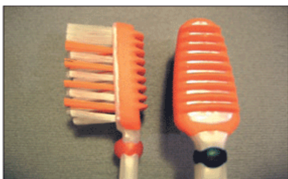
Figura 11 - Escova de dentes com arestas raspadoras.

Uma limitação importante que eles possuem está em soltar a saburra lingual, principalmente em casos de saburra mais severa. Neste caso, eles deixam a desejar, fazendo uma limpeza parcial, não resolvendo assim, satisfatoriamente, o problema de alteração do hálito. Outro inconveniente é que alguns desses limpadores têm a sua ponta ativa com geometria alargada, o que causa ânsia, além de não ter uma boa adaptação ao V lingual, podendo causar ferimentos (Figura 12).