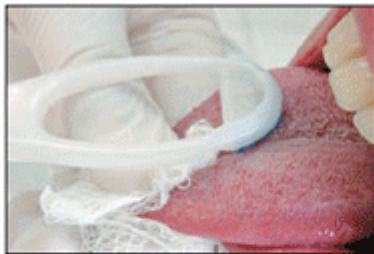
Figura 5 - "Soltando a saburra lingual".