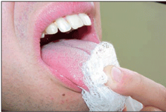
Figura 3 - "Imobilizando a língua".