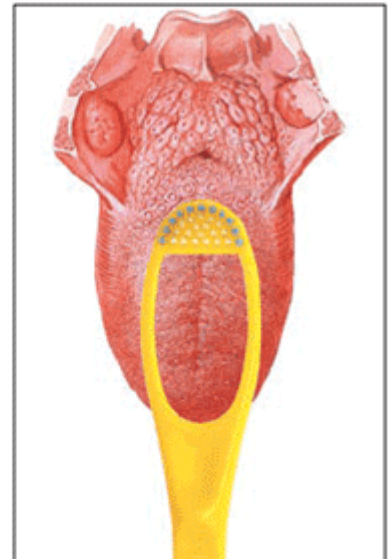
Figura 10 - Limpador de Língua Hálito fresco® - adaptação da ponta ativa com aresta raspadora ao V lingual.

O fluxo salivar pode apresentar-se diminuído por vários motivos; os principais são: o estresse, a ingestão de determinados medicamentos e algumas doenças. Outro fator, não menos importante, é o aumento da descamação de células, que ocorre em várias situações: uso de aparelho ortodôntico, ressecamento provocado pela respiração bucal ou ronco, ingestão frequente de bebidas alcoólicas, uso de enxaguatório com álcool, hábito de mordiscamento dos lábios ou das bochechas e carência de vitaminas essenciais, entre outras.