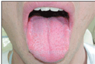
Figura 8 - Língua - aspecto final após a limpeza.