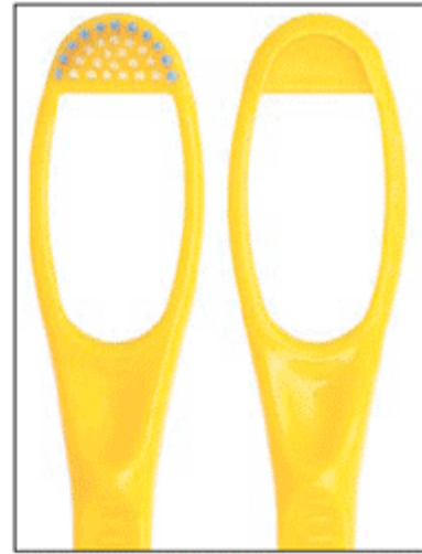
Figura 2 - Limpador de Língua Hálito fresco® - detalhes da ponta ativa.