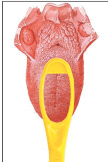
Figura 9 - Limpador de Língua Hálito fresco® - adaptação da ponta ativa com cerdas ao V lingual.